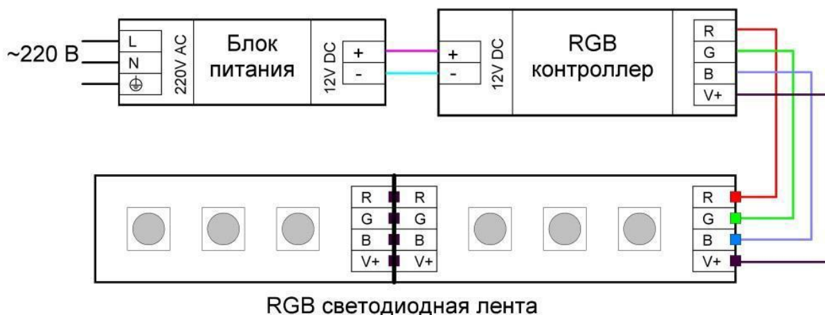
Подключение RGB светодиодной ленты

Контроллеры бывают разные по внешнему виду, мощности, программам управления цветом и пультам дистанционного управления. Но принцип везде один. На контроллер приходит 2 провода от блока питания, а уже от контроллера уходит четыре провода на RGB-ленту. Которые правильно подключаем согласно маркировке на концах провода и ленты соответственно: