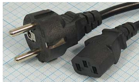
Артикул Q-3066 (прямой)