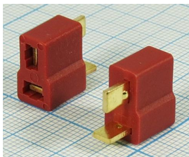
гнездо Deans F